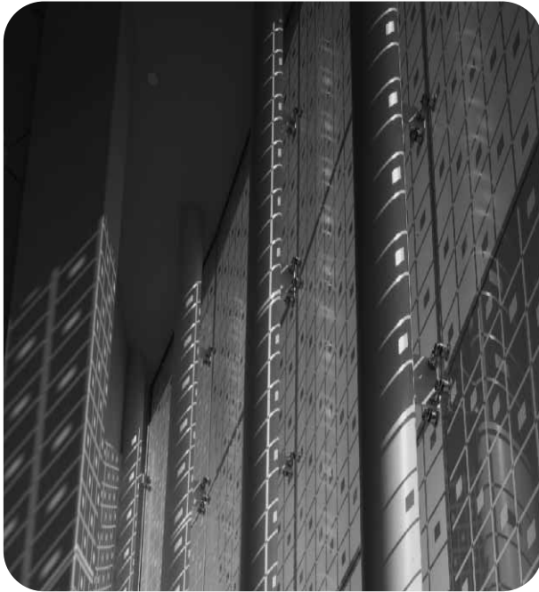
AMC THEATRE, Kalifornia, USA. (Niestandardowy wzór sitodruku)